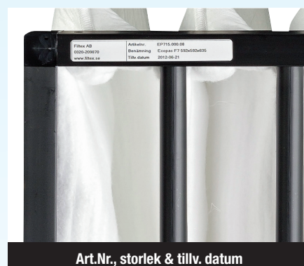
Art.Nr., storlek & tillv. datum